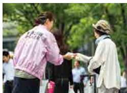
街頭キャンペーンの様子

当社は、乳がんの早期発見の大切さをお伝えするため、認定NPO法人J.POSH(日本乳がんピンクリボン運動)に賛同して、ピンクリボン運動を推進しています。当社の社員が全国の街頭に立って、呼びかけや啓発リーフレット(*)の配布を2005年から行っています。