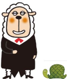
あんしんセエメエ

ヒツジの執事「あんしんセエメエ」は、「お客様のことを第一に考え、いつも丁寧に寄り添う執事やコンシェルジュのような存在でありたい」というコンセプトのもと、人生の頼れるパートナーを目指す当社の企業理念を具現化して生まれたコーポレートキャラクターです。