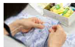
社員が制作した「タオル帽子」